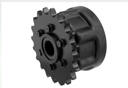
Вариант со сквозным валом