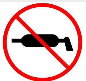
Не требует техобслуживания